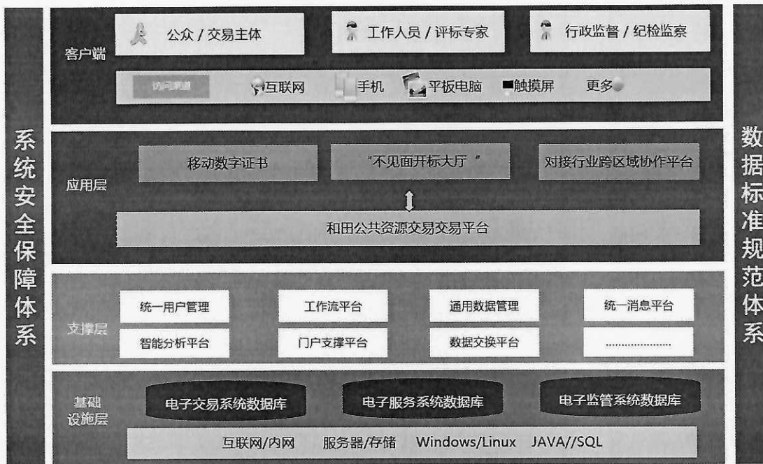
图 3-2 和田地区公共资源交易平台系统架构图